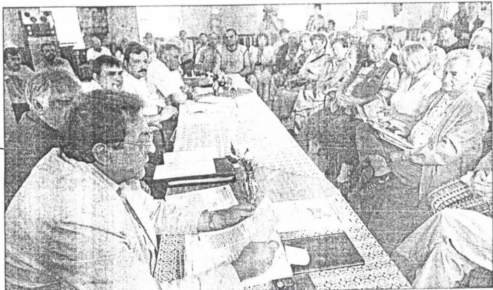
Lokatorzy SM „Perspektywa” chcieli wiedzieć, na co przeznaczane są ich pieniądze.

Druga sprawa to wyjaśnienie treści protokołu zdawczo-odbiorcze-